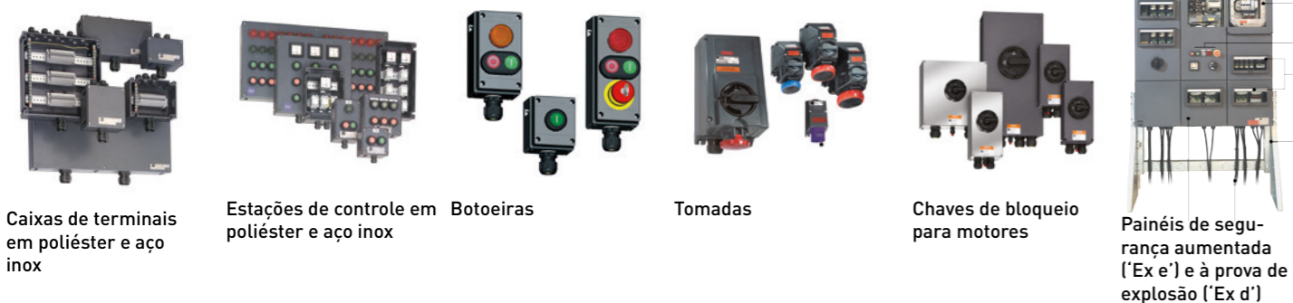
Caixas de terminais em poliéster e aço inox