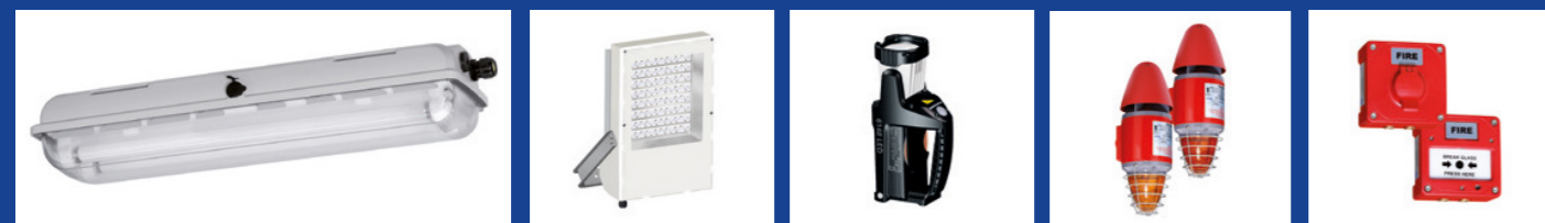
Luminárias lineares fluorescentes e em LED Luminárias de emergência com bateria